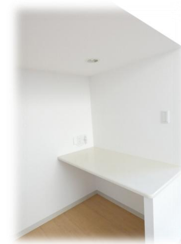
DEN(書斎) 約1.5帖のワークスペース