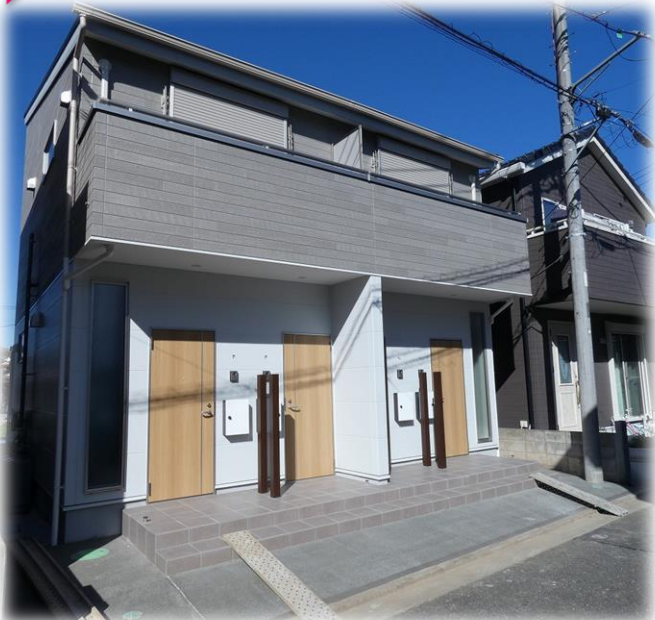
※正面右側が1号室です。