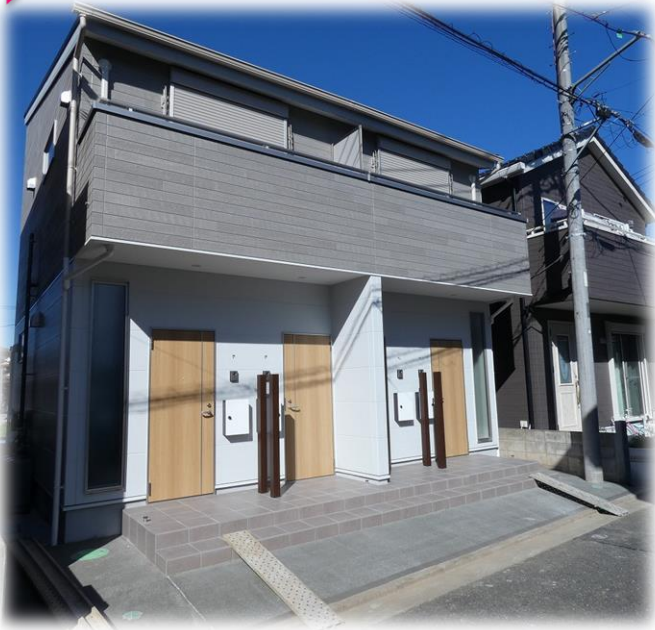
※正面右側が1号室です。