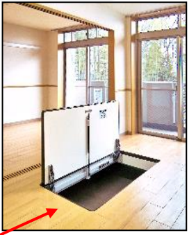
床下収納イメージ