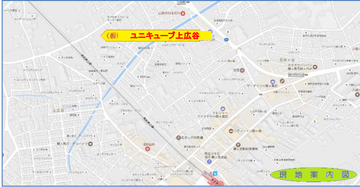
※図面と現況に相違がある場合は、現況優先とします。 ※この図面は業者間図面であり、広告ではありません。